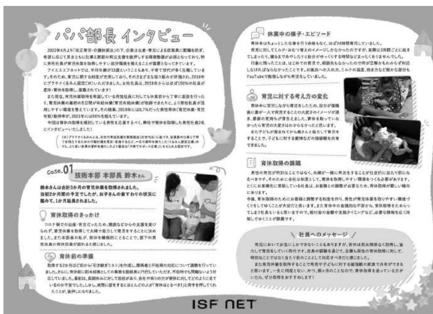
図表2 育児休業取得者の体験談をまとめたパンフレット

「夫婦で育児についてここまで真剣に話し合ったのは初めてだった」「育休取得後の働き方も具体的にイメージできた」といった社員の声もあり、家族間の相互理解や育児休業のスムーズな取得につながっている。