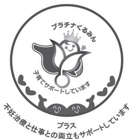
図表4 プラチナくるみんプラス

こうした企業全体の姿勢や成果が評価され、2018年には、厚生労働省より、子育て支援に積極的に取り組む企業の中でも、特に高い水準にある企業として「プラチナくるみん」の認定を受けた。さらに2023年には、「不妊治療と仕事との両立」にも積極的に取り組み、一定の基準を満たした企業として「プラチナくるみんプラス」（図表4）の認定も取得した。当社では今後も、社員一人ひとりが長期的に活躍できる職場環境の実現に向けて、取り組みを進化させていく。