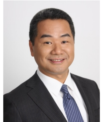
アイエスエフネットグループ代表 静岡県沼津市出身